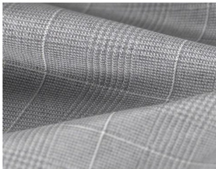
③ 生地品番 CPO124009